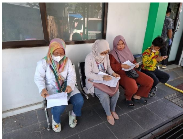
FOTO DOKUMENTASI SURVEI KEPUASAN